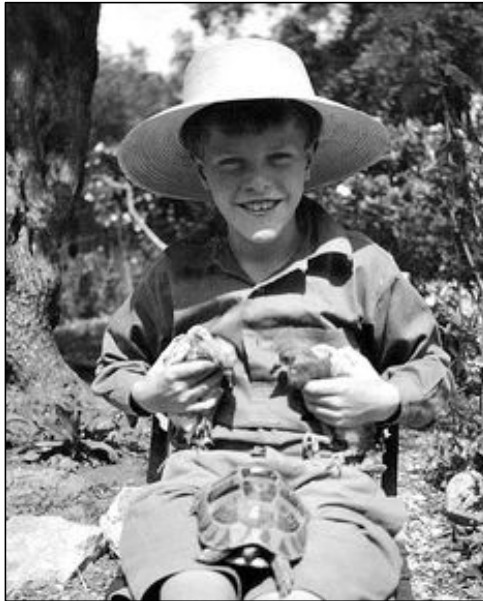
Gerald "Gerry" Durrell